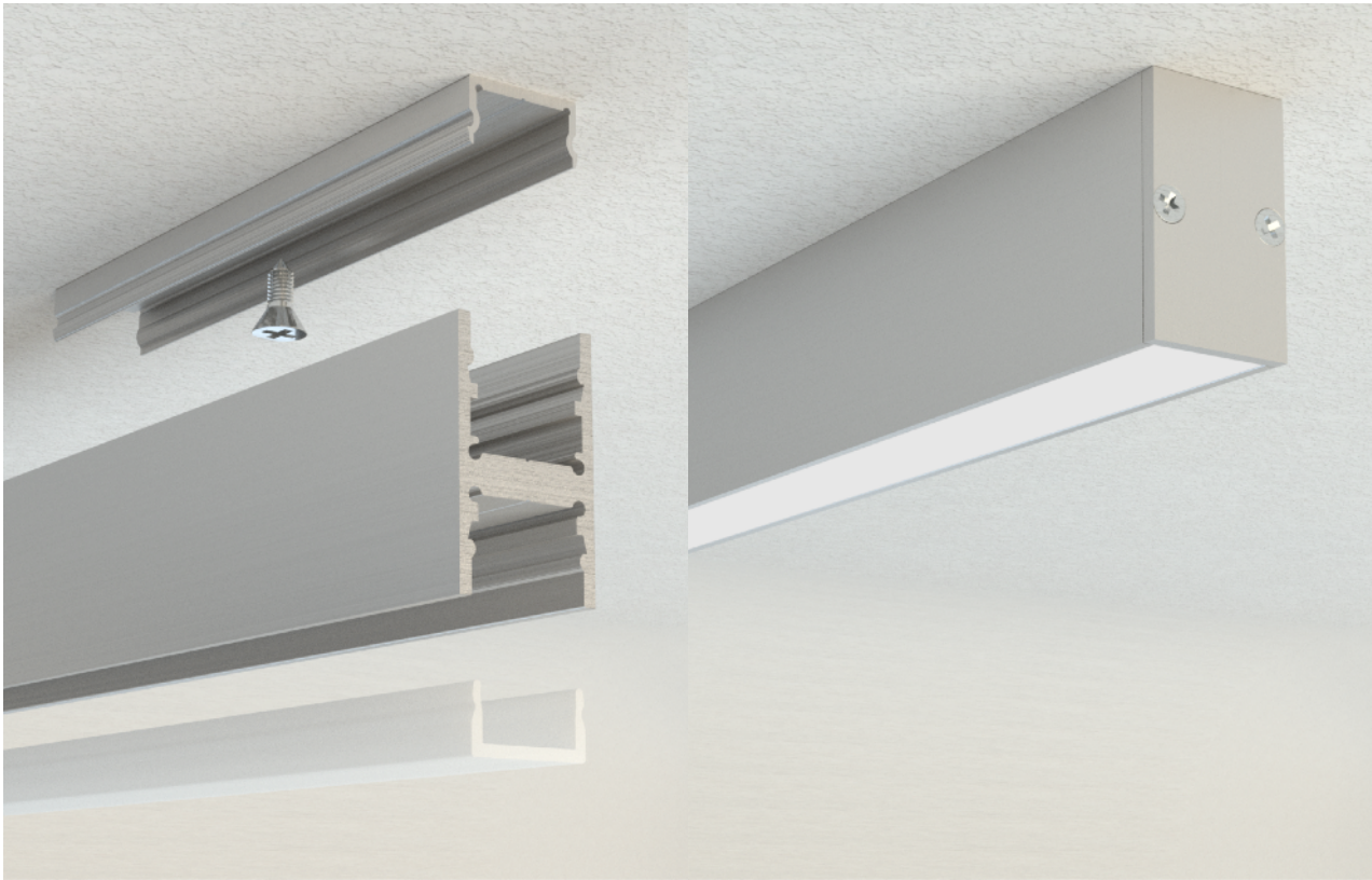
Kit fissaggio a soffitto