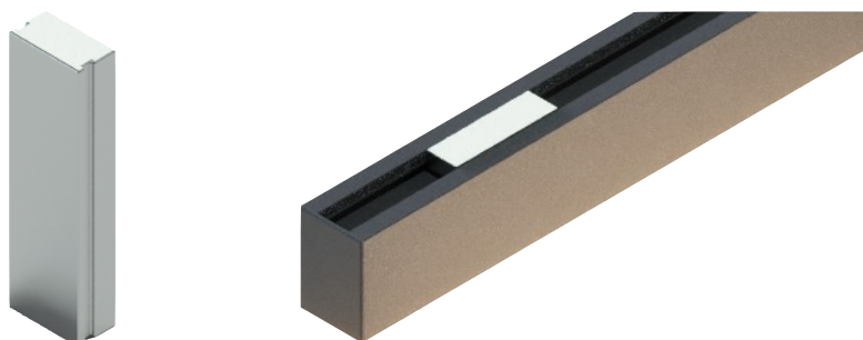
Kit magnete scorrevole