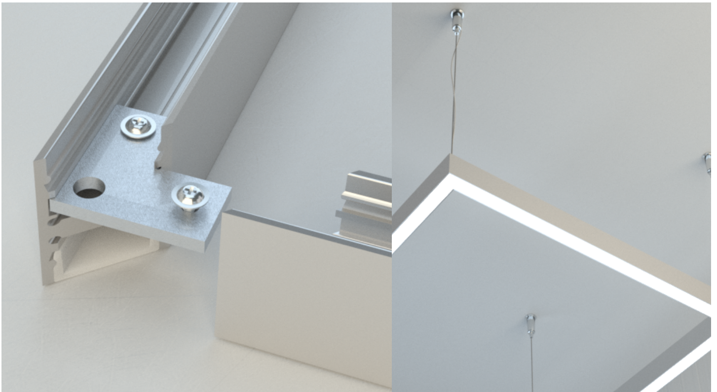
Kit giunzione angolare per kit sospensione